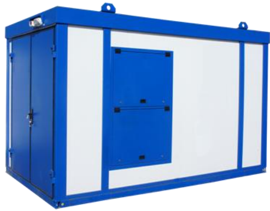
Дизельная электростанция в блок контейнере «Север»

Дизель-генераторные установки в зависимости от условий эксплуатации могут быть выполнены в следующих исполнениях: